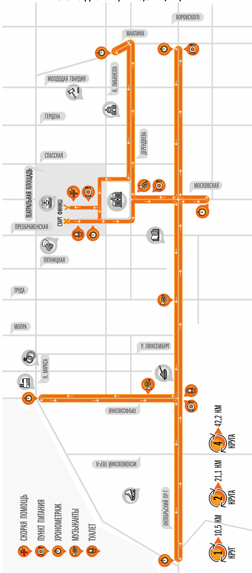
Схема дистанции 10,5 км, 21,1 км