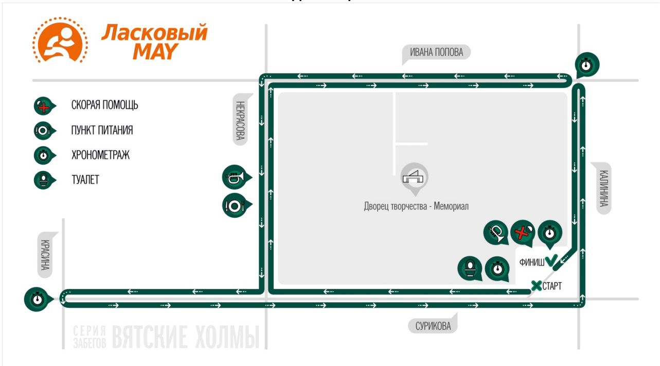
Схема дистанции 2 км