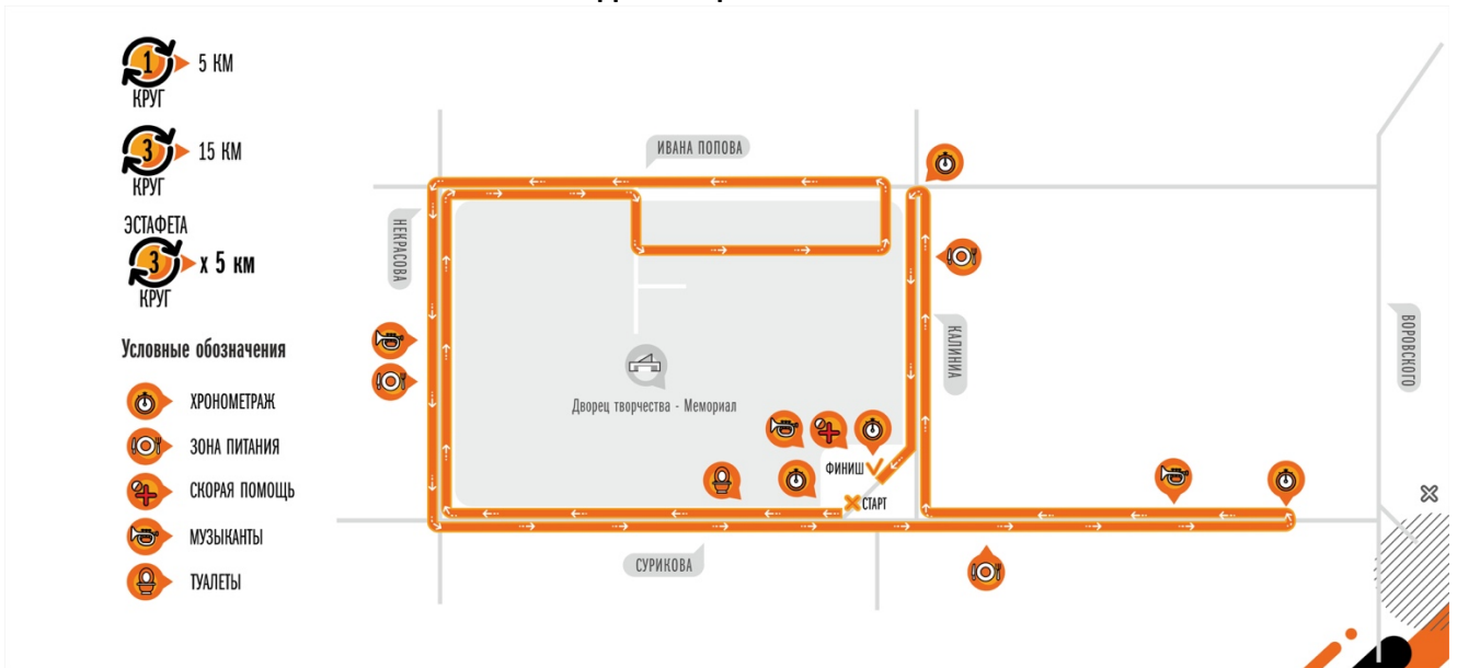
Схема дистанции 2 км